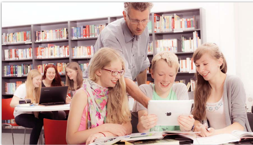
Abb. 1: Soziale Netzwerke sind bei Schülern sehr beliebt. Im Klassenzimmer übernehmen moderne Lern- und Kommunikationsplattformen die Rolle der öffentlichen Netzwerke.

EDYOU ist die verifizierte Lern- und Kommunikationsplattform für die dienstliche Kommunikation zwischen Schülern und Lehrern, die zuletzt durch eine Pilotschule in Baden-Württemberg evaluiert wurde.